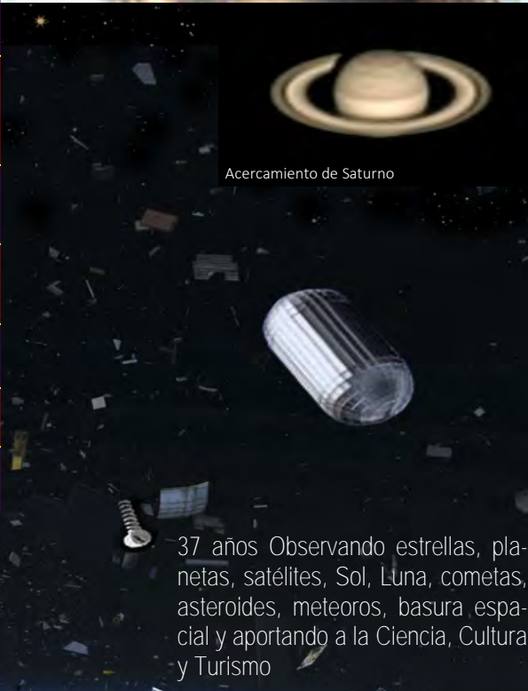
Acercamiento de Saturno