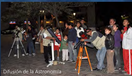
Difusión de la Astronomía