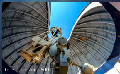
Telescopio Zeiss 600