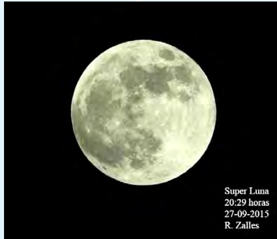
Super Luna 20:29 horas 27-09-2015

Primera superluna del año, cuando la Luna llena se ubica en el punto de su órbita más cercano a la Tierra, aproximadamente a 357.615 kilómetros, se dice que está en el perigeo, por lo que la Luna parece un poco más grande y brillante que en otras ocasiones, lo que desencadena el fenómeno llamado superluna.