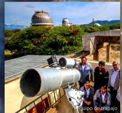
Equipo de trabajo