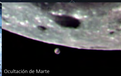
Ocultación de Marte

37 años Observando estrellas, planetas, satélites, Sol, Luna, cometas, asteroides, meteoros, basura espacial y aportando a la Ciencia, Cultura y Turismo