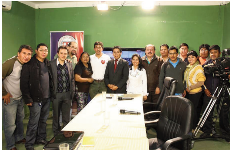
Diferentes debates del ciclo de programas “La Prensa Pregunta”