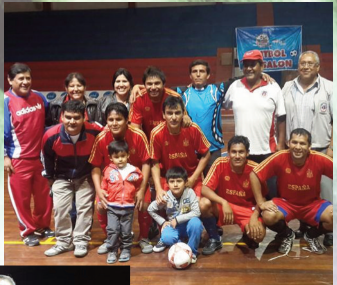
Equipo de DTIC obtuvieron el segundo lugar en el certamen atlético.