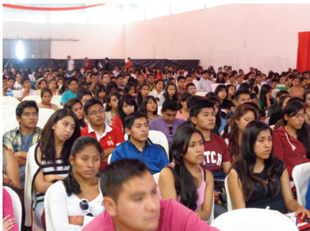
Estudiantes de Medicina en el Congreso.