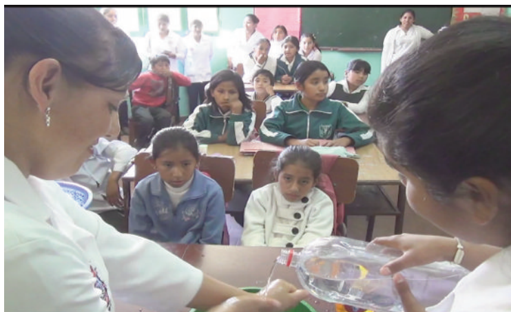
Universitarios enseñando a niños a lavarse las manos para prevenir enfermedades

Los estudiantes de la carrera de Enfermería de la UAJMS, de la materia Salud Ambiental y Ocupacional, con la finalidad de contribuir en el tratamiento a la actual problemática ambiental, orientaron a los niños de primaria sobre los distintos elementos que componen el medio ambiente y las relaciones que se establecen entre ellos también concientizan, promueven valores y realizan