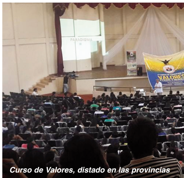
Curso de Valores, dictado en las provincias

Por primera vez la UAJMS capacitó masivamente a los universitarios en jornadas reflexivas sobre los valores ético-morales. La iniciativa surgió a través de un proyecto presentado por la Federación Universitaria Local (FUL) la pasada gestión 2013. Una vez aprobado el proyecto, la Dirección de Extensión Universitaria llevó a cabo dichos cursos en todas las facultades que tiene la “Juan Misael