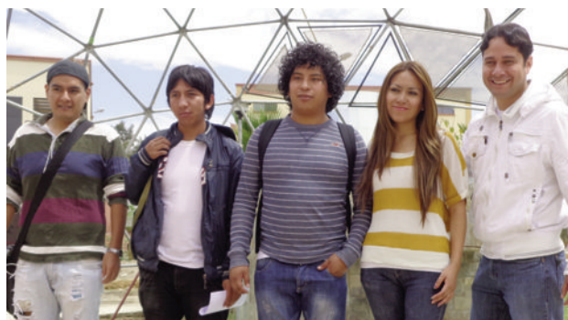
Representación estudiantil de la UAJMS que participó en Arquisur.