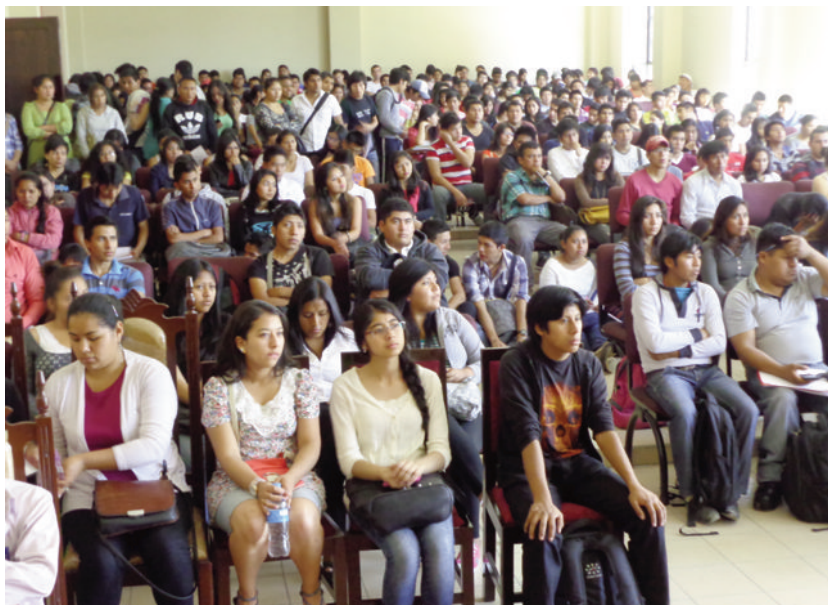
Masiva asistencia de los universitarios a los cursos de Valores

bién a las unidades académicas en las provincias, constatando con agrado la participación activa de los estudiantes. “Como Universidad estamos cumpliendo con nuestra misión y visión institucional, la de formar profesionales íntegros, comprometidos y responsables con la sociedad, esas virtudes se construyen con el conocimiento y práctica de los valores ético morales y nos es muy grato concluir este ciclo de formación con gran éxito, agradeciendo la gestión de nues-