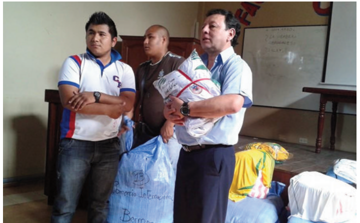
Rector entregando ropa deportiva a estudiantes.