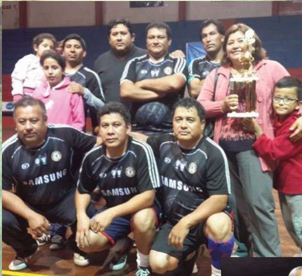
Equipo de Personal ganador del campeonato deportivo Docente Administrativo.