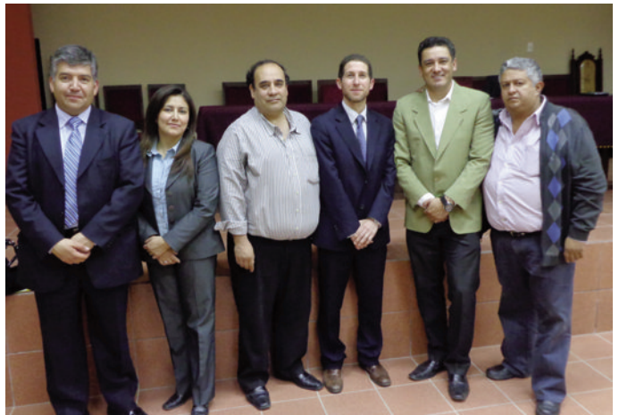
Al medio Director de Rel. Internacionales UAJMS y Vicecónsul de EE.UU.

Los representantes de Estados Unidos señalaron que cada año a partir del 1 de octubre la embajada de ese país lanza una convocatoria de lotería de visas, con el único requisito de ser bolivianos y tener 12 años de estudio (colegio). Asimismo, aclararon que estas postulaciones son sencillas, no necesitan tramitadores y la Embajada jamás cobra dinero por dar información, reiterando que se debe tener cuidado con las personas que desean estafar y engañar cobrando exorbitantes sumas de dinero por la visa americana.