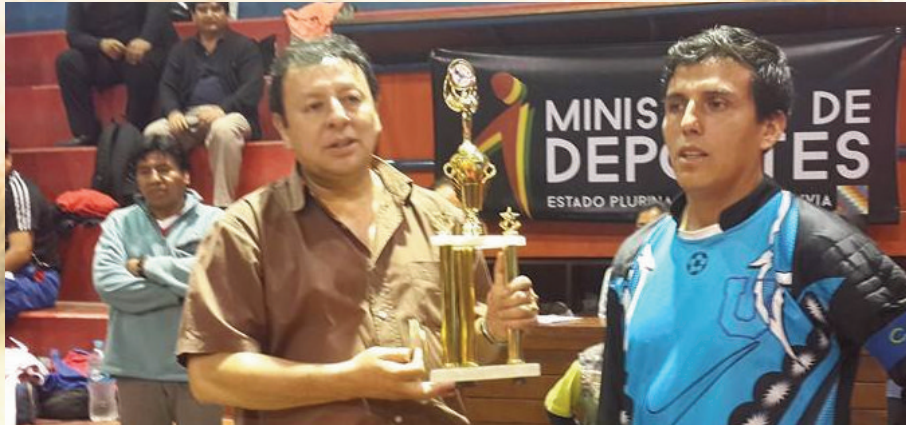
El Rector clausurando el campeonato y entregando el trofeo al equipo ganador.