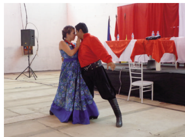
Chacarera, número musical presentado por el Ballet Universitario en la inauguración del Congreso.

Vértigo, bailando al son de grupos argentinos, bolivianos y neoyorquinos como DLG. Y como broche de oro una vez concluido el evento, todos los asistentes deleitaron una riquísima parrillada en la Casa Vieja – El Valle.