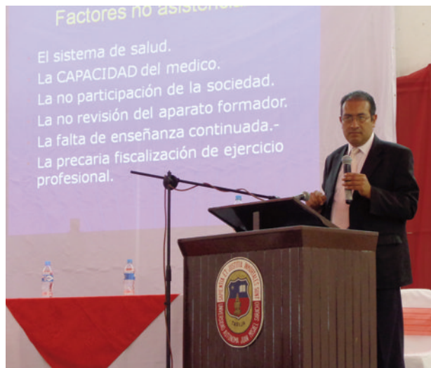
Vicepresidente del Colegio Médico de Bolivia.

Vértigo, bailando al son de grupos argentinos, bolivianos y neoyorquinos como DLG. Y como broche de oro una vez concluido el evento, todos los asistentes deleitaron una riquísima parrillada en la Casa Vieja – El Valle.