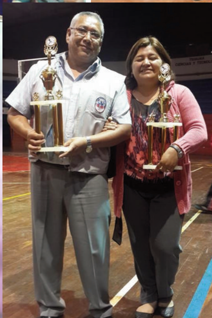
Director de Personal “Recursos Humanos” y Directora de DTIC mostrando las preesas ganadas por sus equipos.