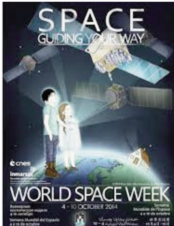
Afiche oficial del evento.

Los eventos de la Semana Mundial del Espacio se celebran en todo el mundo, en las escuelas, universidades, centros de