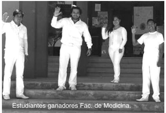
Estudiantes ganadores Fac. de Medicina.