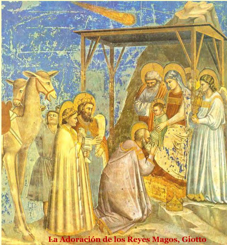
La Adoración de los Reyes Magos, Giotto

El Planetario GOTO GS, sofisticado instrumento donado por el pueblo y gobierno del Japón a nuestro Observatorio permite recrear incluso los cielos que se veían hace miles de años y al ser diciembre y enero época alta de turistas en Tarija y siendo el Observatorio uno de los sitios turísticos más visitados, se mostrará una sesión especial de Planetario: la simulación del cielo de Belén de hace 2018 años, en la que a través del relato de los técnicos planetaristas desentrañaremos los misterios que envuelven esta conmovedora historia de la “Estrella de Belén”. Antropólogos, historiadores y astrónomos han estudiado el relato que afirma que algo se vio en el cielo, entre estrellas y planetas, constelaciones y cometas, haremos junto al público un viaje visual al pasado, para volver al lugar y momento