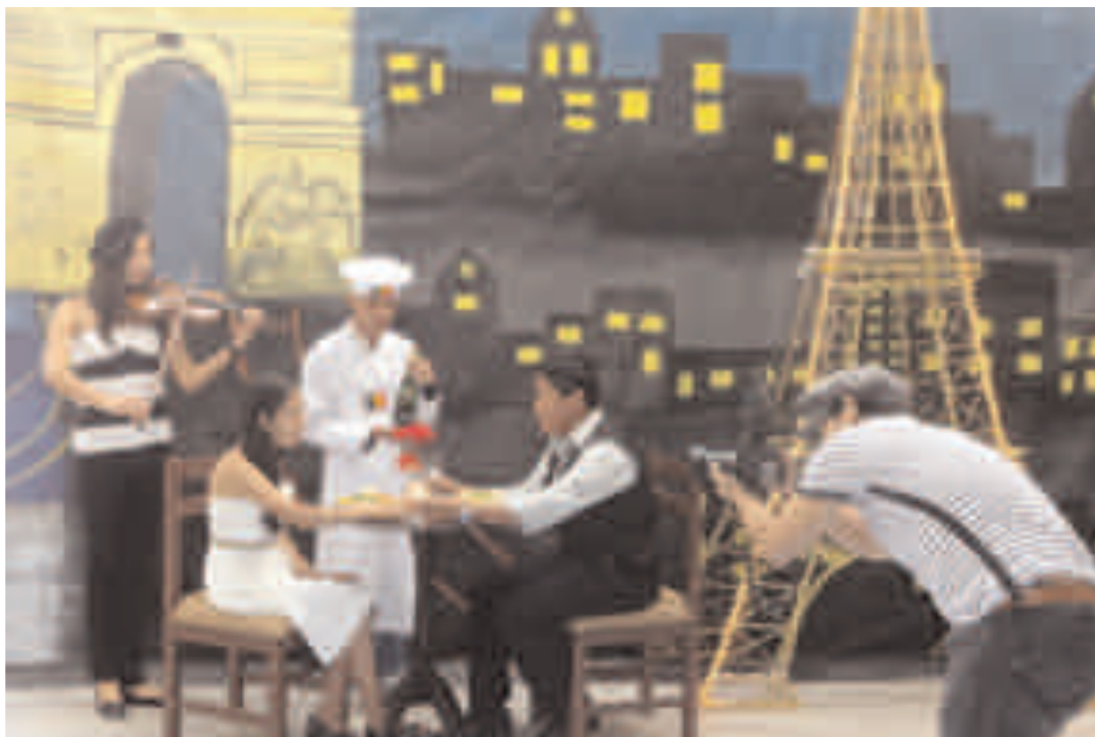
Una típica escena del Boulevard Parisense, recreada en el Bloque de Humanidades.

La fecha elegida para esta celebración es el aniversario de la creación de la primera organización francófona, la Agencia de Cooperación Cultural y Técnica, en la Conferencia de Niamey en 1970.