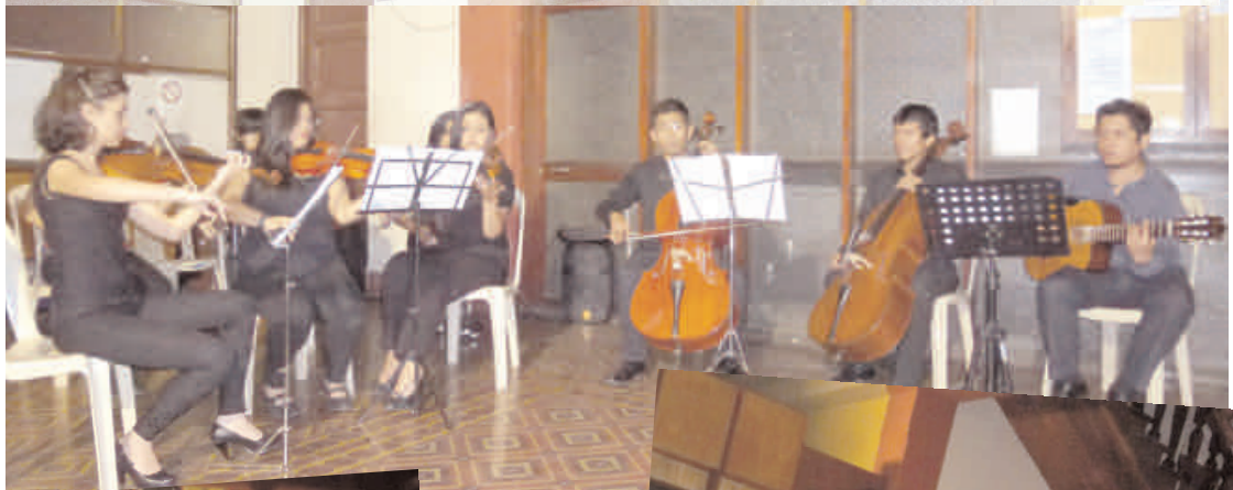
La Orquesta Sinfónica San Francisco Javier de Chuquisaca en el Hall del rectorado.