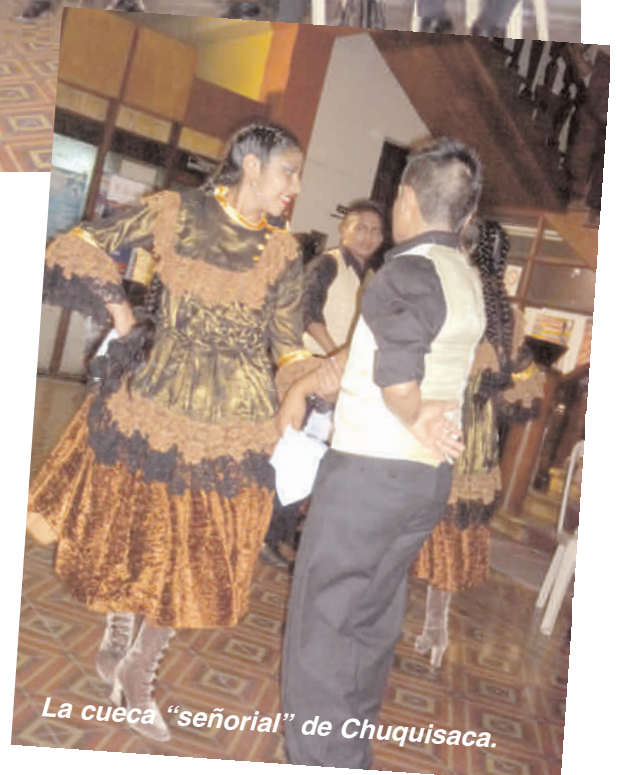
La cueca "señorial" de Chuquisaca.