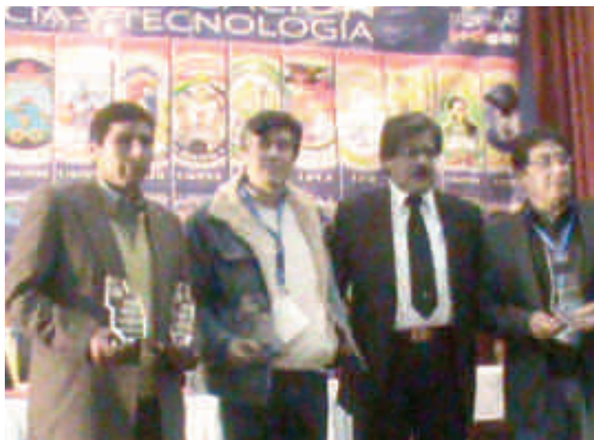
El Rector de la UMSA entregó reconocimientos de participación a los Responsables de la Investigaciones presentadas por la UAJMS en esta Feria de Ciencias y Tecnología realizada en la ciudad de La Paz.