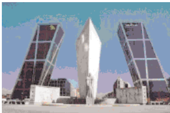
La imponentes torres de la Puerta de Europa acentúan el moderno paisaje urbano de Madrid. Otro referente del modernismo actual.

“Nunca en la historia se ha tenido tanto dinero ni tantas posibilidades de ser felices. Sin embargo, la infelicidad, la insatisfacción, son la marca de nuestro tiempo y eso es lo que quiere la sociedad líquida: Personas y sociedades insatisfechas dispuestas a comprar, a transformarse, a mantener activo el aparato de consumo. Es una realidad