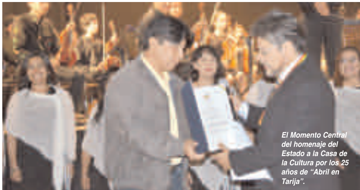
El Momento Central del homenaje del Estado a la Casa de la Cultura por los 25 años de “Abril en Tarija”.

En el marco de las políticas nacionales de incentivo y protección cultural, El ministerio de Cultura y Turismo del Estado Plurinacional de Bolivia condecoró a la Casa de la Cultura de Tarija con la Medalla al Mérito “Adela Zamudio” por haber cumplido más de 25 años de aporte a la preservación del Patrimonio Cultural tarijeño y de efectivo trabajo realizado en la promoción del arte y la cultura nacional, sobre todo a través del Festival Internacional de la Cultura “Abril en Tarija”, mismo que fue declarado Patrimonio Nacional mediante Ley del 29 de abril del año 2005.