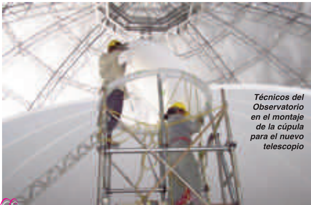
Técnicos del Observatorio en el montaje de la cúpula para el nuevo telescopio