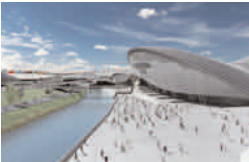
Uno de los escenarios deportivos de la Olimpiadas 2012 en Londres que refleja las tendencias de la sociedad líquida.