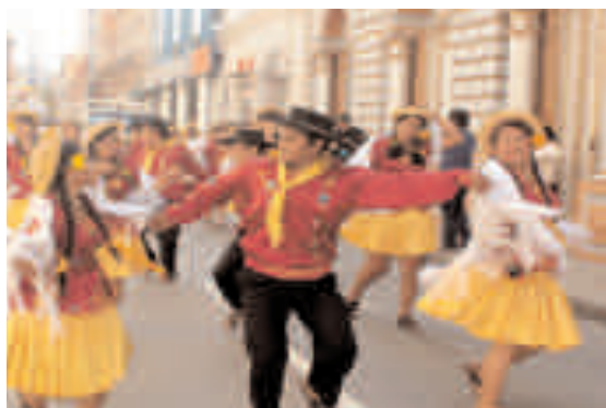
Una estampa de la Entrada Folklórica de la Escuela Superior de Formación de Maestros con la que “Abril en Tarija” abrió el telón del arte y la cultura.