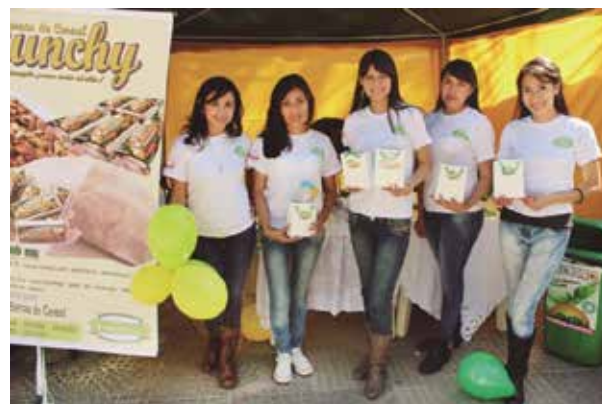
IMAGEN N° 1: MUJERES EMPRENDEDORAS EMPRESA B-ENERGY S.R.L. BARRA DE CERELAES "Sabor y energía para todo el día"