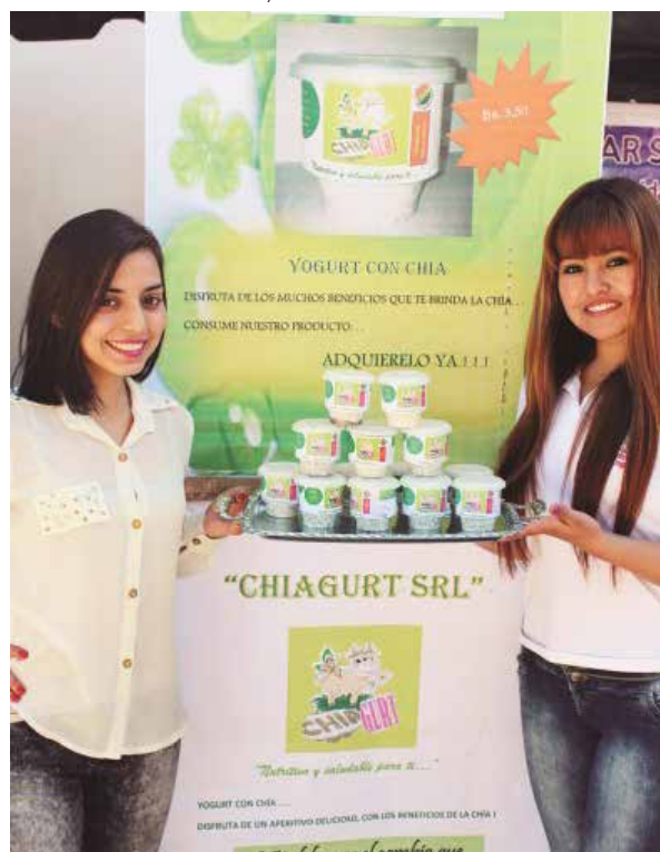
IMAGEN N°2: EMPRESA CHIAGURT SRL-YOGURT CON CHÍA "Nutritivo y Saludable"