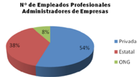
Figura 3: Número de empleados según tipo de entidad