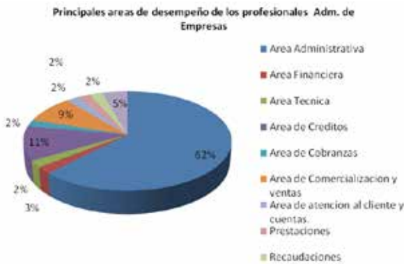
Figura 2: Principales áreas de desempeño