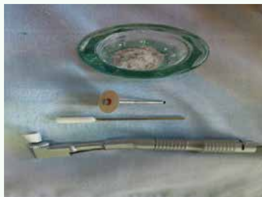
Fig.5: instrumental para prótesis

de la prótesis, nombrando los materiales top que se usan y los materiales que usó, analizando y comparando, describiendo ventajas y desventajas, etc. Ej: Terminada toda la preparación mecánica, con las llaves de silicona obtenidas al principio se confecciona provisorios de acrílico autopolimerizable, con las características del color similar al de los dientes remanentes se debe pulir y hacer control de oclusión para que no sea una interferencia oclusal, estos provisorios también servirán para que la paciente comience a adaptarse y así mismo su encía.