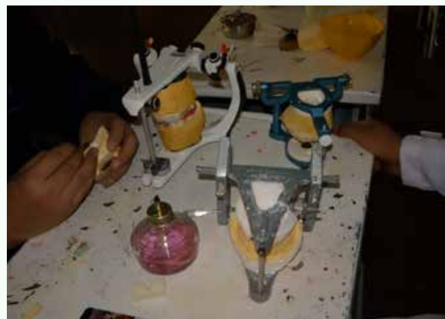
Figura 1: podemos observar 3 tipos de articuladores de 3 estudiantes