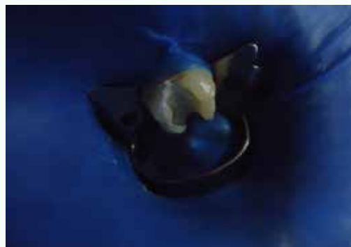
Fig.4: Preparación para prótesis