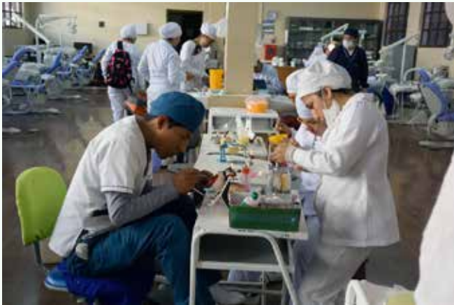
Figura 2: Estudiantes de varios niveles interactúan

el nivel de desarrollo potencial (aquellos que sería capaz de hacer con la ayuda de un adulto o un compañero más capaz). Este concepto sirve para delimitar el margen de incidencia de la acción educativa. La zona de desarrollo próximo se genera en la interacción entre la persona que ya domina el conocimiento o la habilidad y aquella que está en proceso de adquisición. Es por tanto una evidencia del carácter social del aprendizaje. 2