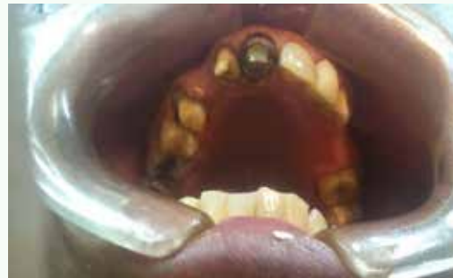
Fig. 3: Preparación pre-protética