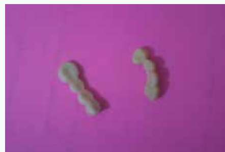
Fig.6: Prótesis provisional